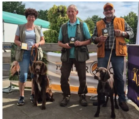
vainqueurs CBBA compétitions 2025

2/ Nous sommes en train de préparer la nouvelle saison de compétition. Les dates et les lieux ne sont pas encore connus, ils doivent encore être confirmés par plusieurs commissions. Dès que les dates du clubmatch, des épreuves d'essai et des concours sur le terrain ainsi que leurs lieux seront connus, ils seront publiés sur le site web, sur Facebook et dans une prochaine newsletter.